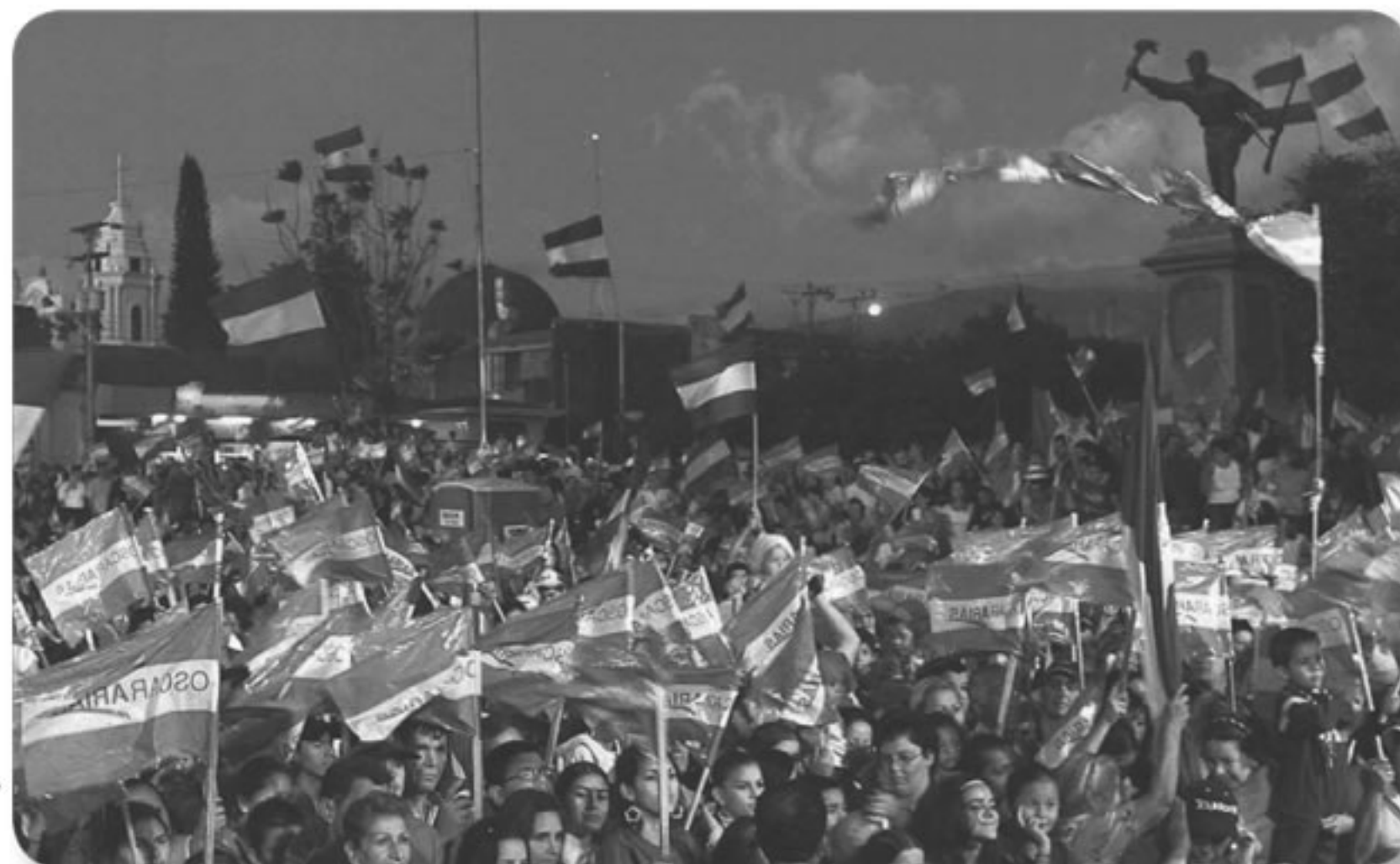
El partido Liberación Nacional ha recibido hasta la fecha más de 190 millones de colones en donaciones.

Estos personeros deben tomar en cuenta que, según el artículo 176 bis del Código Electoral, "de no informar a tiempo, el Tribunal Supremo de Elecciones los prevendrá, personalmente, para que cumplan con esta obligación dentro de los