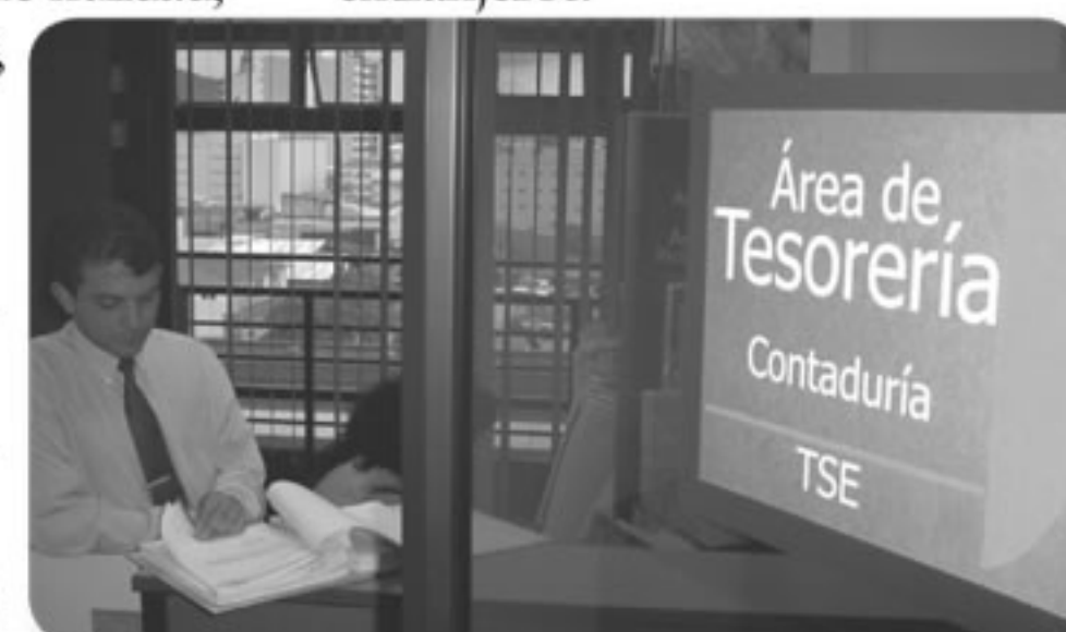
En la actualidad el Código Electoral contempla un tope de 24 millones de colones para las donaciones que pueden hacer las personas a las agrupaciones políticas.

Además, recientemente la Comisión que discute las reformas electorales ratificó que los partidos políticos no podrán abrir cuentas bancarias en el extranjero. La moción aprobada impide a las agrupaciones depositar o captar recursos en cuentas abiertas en bancos extranjeros.