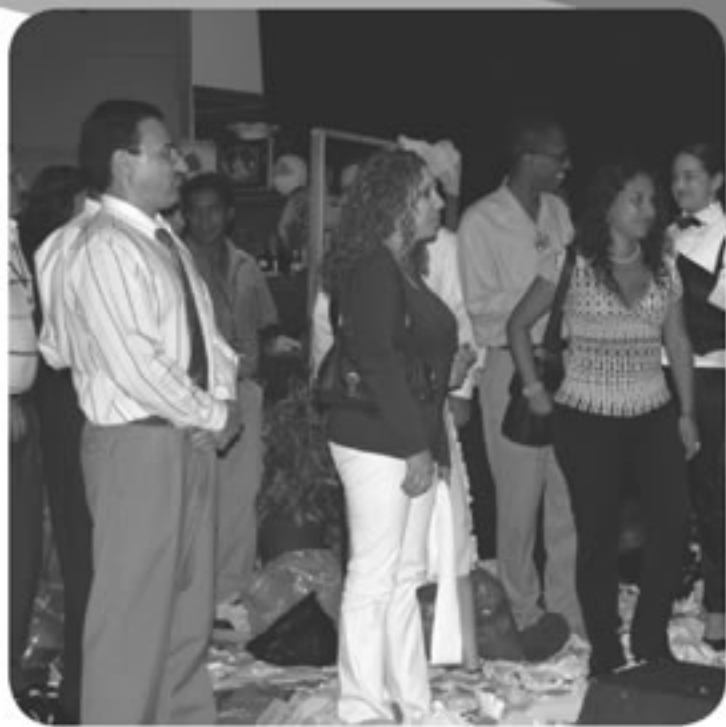
La obra "Única Mirando al Mar" fue dedicada a todos nuestros compañeros de las Oficinas Regionales