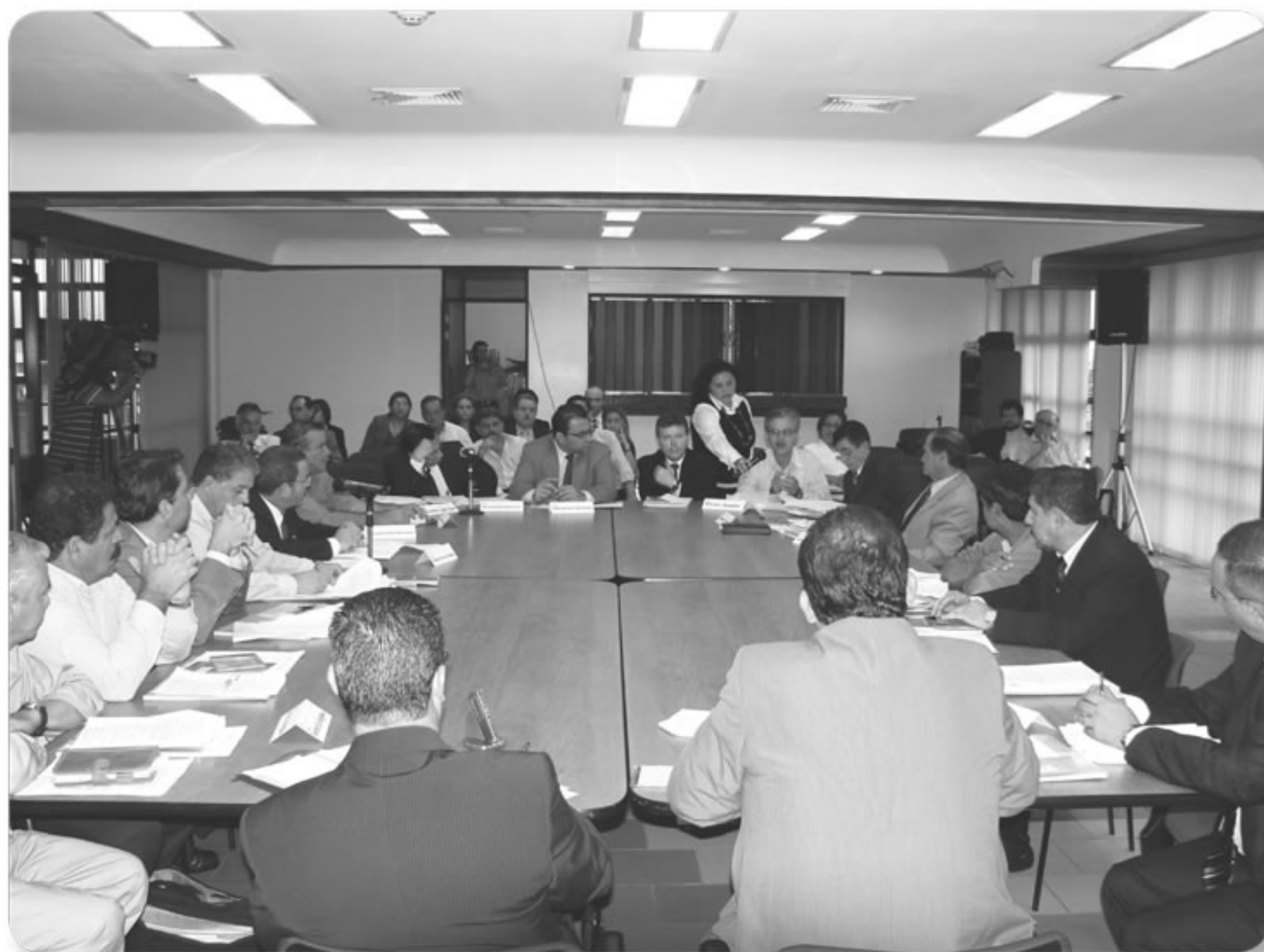
El pasado 1º de octubre el TSE instaló el Consejo de Partidos Políticos. La próxima sesión será el 10 de noviembre.