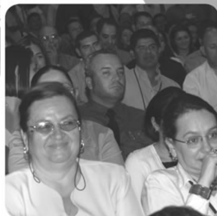
La participación al Bingo 2008, organizado por la ASOTSE, sobrepasó la cantidad del 2007. Esperamos que año con año concurren más compañeros y que los premios en efectivo se den en el momento.