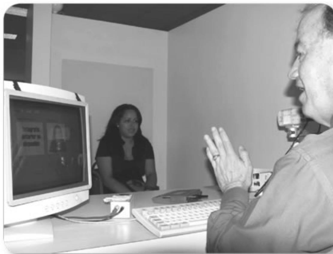
El gobierno digital obliga al TSE a incorporar una infraestructura tecnológica robusta y de punta.

datos e imágenes, optimizar el tiempo de entrega del documento de identidad a un día como máximo en casos de solicitudes normales y descentralizar la impresión de cédulas según las posibilidades tecnológicas, económicas y administrativas de las oficinas regionales.