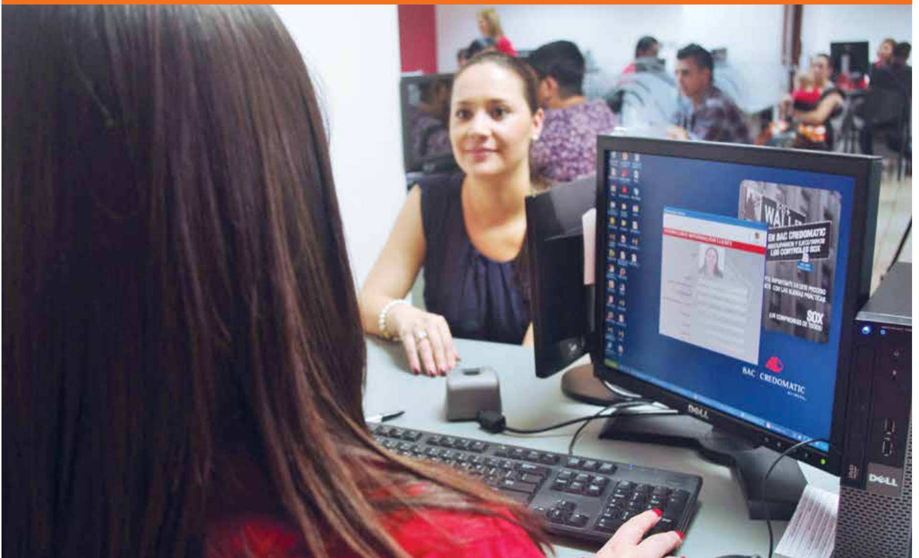
Radiográfica Costarricense (RACSA) es el aliado comercial del TSE en este proyecto que salió a la luz pública el pasado 20 de mayo. BAC San José es uno de los actuales clientes del VID.

NOTICIAS DEL TSE, pág. 4 ¿Conoce usted la realidad del cantón donde vive? Entérese a través del Fichero Cantonal disponible en el sitio www.tse.go.cr