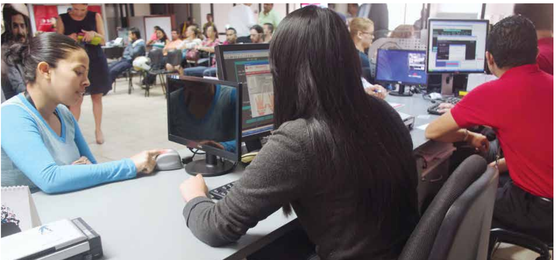
Uno de los primeros clientes de este servicio ofrecido por el TSE es el BAC San José. En la imagen ilustrativa se aprecia el sistema verificador en la pantalla de la computadora. Al cierre de esta edición había al menos 60 empresas interesadas en obtener este producto.

Aunque es la primera vez que el TSE cobra por un producto comercial, se le recuerda a toda la ciudadanía que los servicios esenciales, tales como la cédula de identidad, certificaciones, naturalizaciones, tarjetas de identidad de menores, entre otros, siguen siendo totalmente gratuitos.