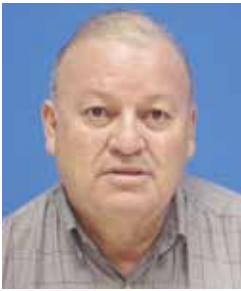
Jorge Prendas Publicaciones