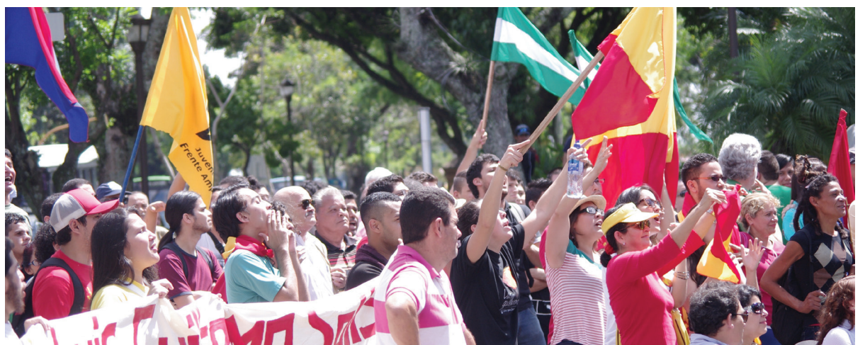
Los funcionarios públicos mencionados en el artículo 146 del Código Electoral deberán abstenerse de participar en actividades partidistas. Además, tendrán que renunciar si aspiran a un cargo municipal

En caso de que los servidores públicos anteriormente citados contravengan estas prohibiciones, el TSE podrá ordenar la destitución e imponer inhabilitación para ejercer cargos públicos por un período de 2 a 4 años.