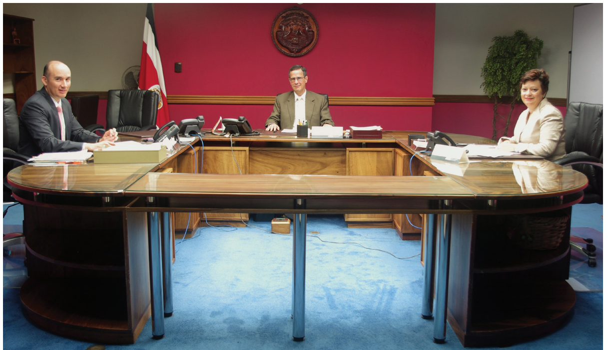
La Magistrada Luz Retana Chinchilla y el Magistrado Juan Antonio Casafont Odor formarán parte del actual Tribunal.

La Magistrada Retana ocupa su cargo suplente en el TSE desde el 2 de abril de 2013 y el Magistrado Casafont desde el 10 de julio de 1989.