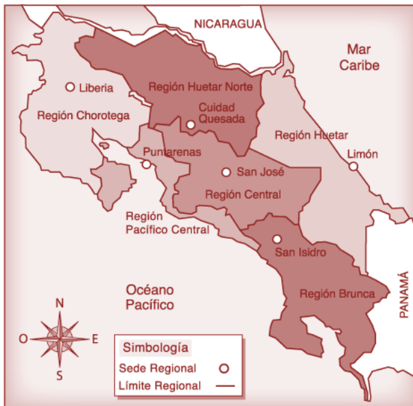
Figura 1. Mapa socioeconómico de Costa Rica. Instituto Costarricense de Educación Radiofónica, 2011.

La inequidad urbano-rural/costera puede deberse en parte a la alta centralización del Gobierno costarricense. Una reforma constitucional en 2001 estableció la transferencia del 10% del presupuesto nacional a los municipios (escalonado a 1,5% anual) acompañada de la transferencia de funciones específicas. Sin embargo, a pesar del marco legal, las limitaciones financieras han impedido la ejecución de la descentralización. Paradójicamente, mientras las enormes asimetrías en términos de la capacidad de gestión entre los municipios representan un gran reto para la descentralización, la alta centralización de la gestión pública dificulta el desarrollo y progreso de las zonas más alejadas de la meseta central.