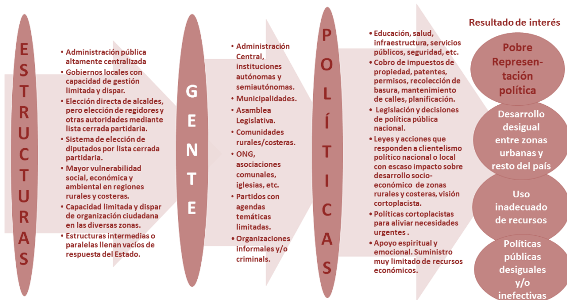
Figura 2. Embudo de causalidad.

herramienta se centra, principalmente, en lo relativo a la calidad de la representación en el congreso en un sistema proporcional por lista cerrada, y sus posibles efectos en el desarrollo socioeconómico de las zonas rurales y costeras.