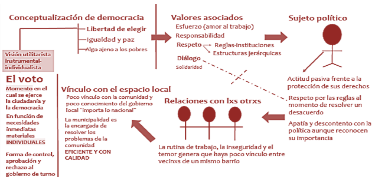
Figura 2. Principales núcleos discursivos para las entrevistas efectuadas en San José, Curridabat y Alajuela. Elaborado con base en la información del CIEP, 2018

la consulta conllevó profundizar sobre el ejercicio del voto y su vínculo con la democracia, entendida desde la esfera local 9 .