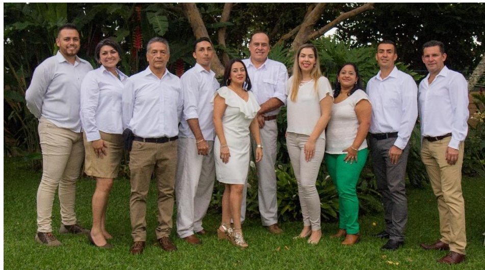
Candidatos a Regidores