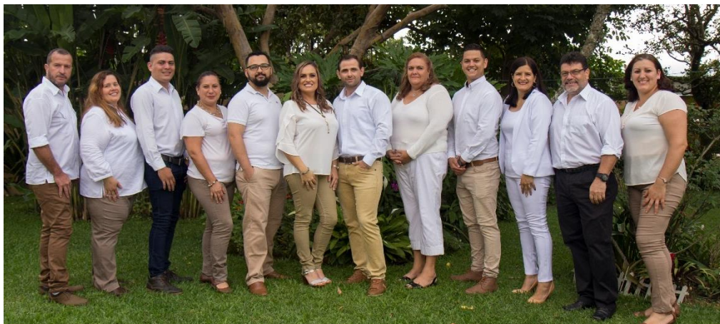
Candidatos a Síndicos