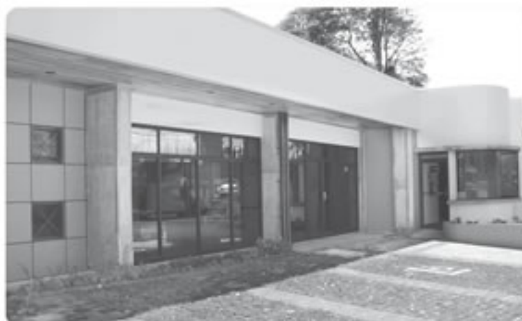
En enero del año entrante los funcionarios de la Regional del TSE en Cartago estrenarán este edificio. La nueva oficina costó aproximadamente 200 millones de colones.

En el 2001, el TSE compró ese terreno de 485 metros