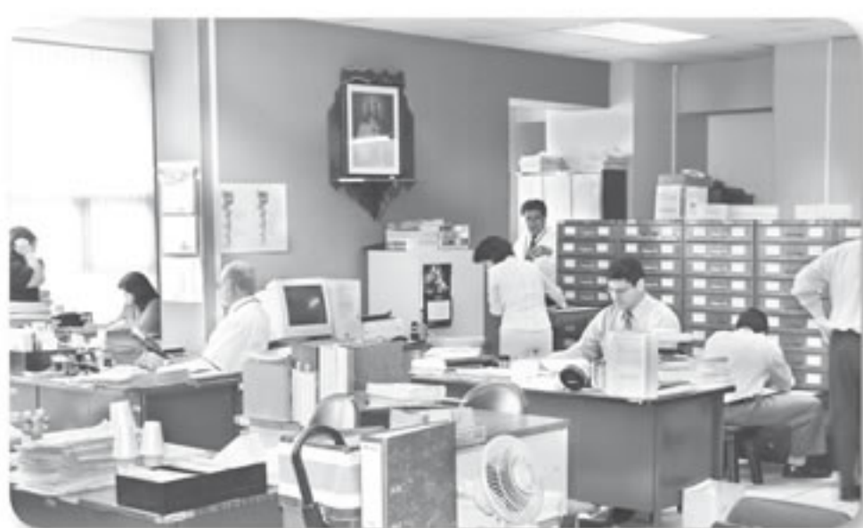
La medida se aplicaría en Sede Central y en las oficinas regionales, excepto en Aguirre, Upala y Talamanca.

La Unión Nacional de Empleados Electorales y Civiles (UNEC) se manifestó