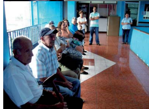
Durante el mes de julio funcionarios del TSE visitaron 47 municipalidades del país para realizar trámites vinculados con la cédula de identidad.