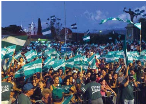
Desde el 5 de julio todos los partidos políticos pueden acudir al TSE para solicitar la autorización respectiva para realizar actividades en sitios públicos.

Desde el pasado 5 de julio, todos los partidos inscritos en el Tribunal Supremo de Elecciones (TSE) pueden presentar las solicitudes de permisos para realizar actividades en sitios públicos, con el fin de que el órgano electo-