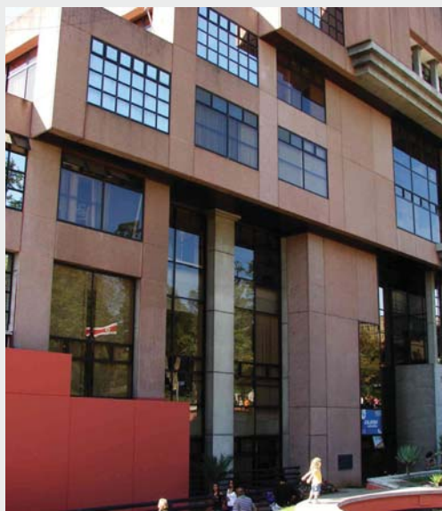
En los próximos meses se ejecutará el denominado Sistema de Gestión de la Calidad en los procesos registrales y electorales del TSE.

A solicitud del TSE, la OEA esta gestionando con el comité ISO internacional una nueva norma de gestión de la calidad para or-