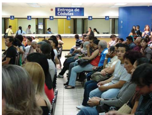
Uno de los objetivos de esta campaña publicitaria es que los costarricenses hagan conciencia acerca del valor e importancia de la cédula de identidad.

Así, al mes de abril pasado, existían aproximadamente 60 mil cédulas sin retirar a nivel nacional. Además, durante el año 2009,