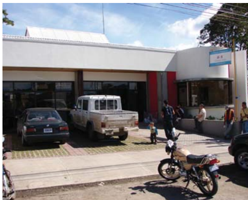
Desde junio los usuarios del TSE podrán retirar sus certificaciones solicitadas a través de la página web en siete oficinas regionales, incluida la de Cartago.

Desde mediados de junio los usuarios del Tribunal Supremo de Elecciones (TSE) que soliciten por Internet certificaciones con información registral civil