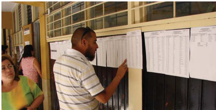
El mensaje de texto que recibieron millones de costarricenses en sus teléfonos celulares les recordaba el plazo para realizar su traslado electoral o para solicitar su cédula por primera vez.

A inicios de este mes, el Tribunal Supremo de Elecciones (TSE), en convenio con el Instituto Costarricense de Electricidad (ICE), envió un mensaje de texto a todos los usuarios de la telefonía celular del país, donde les recordará la fecha del cierre del padrón electoral.