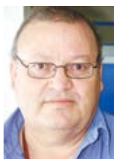
Jorge Prendas Servicios Generales

“Carne de yugo, ha nacido mas humillado que bello con el cuello perseguido por el yugo para el cuello. Nace como la herramienta A los golpes destinado, De una tierra descontenta Y un insatisfecho arado. Lo veo arar los rastros Y devorar un mendrugo, Y declarar con los ojos Que porqué es carne de yugo.”