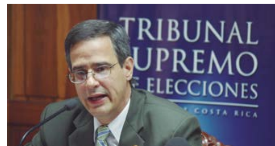
El Magistrado Presidente del TSE, Luis Antonio Sobrado, explicó a los medios de comunicación en conferencia de prensa que uno de los objetivos de la propuesta es que las agrupaciones políticas accedan oportunamente a los recursos necesarios para enfrentar la campaña electoral.

Las propuestas han sido especialmente cuidadosas en no sacrificar los logros alcanzados en términos de transparencia y control del financiamiento partidario, que más bien se