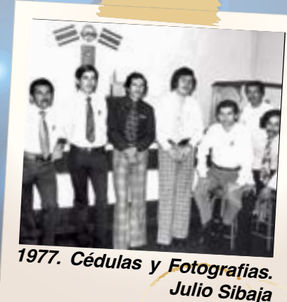
1977. Cédulas y Fotografías. Julio Sibaja