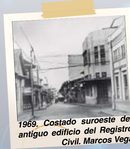
1969. Costado suroeste del antiguo edificio del Registro Civil. Marcos Vega