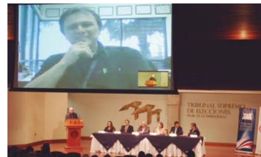
Durante la celebración del Día Nacional del Costarricense en el Exterior se contó con la participación -vía Skype- del científico Franklin Chang Díaz.

De igual forma, la celebración se engalanó con la participación del científico costarricense Franklin Chang Díaz, quien vía Skype se refirió a sus experiencias siendo un “tico” en el exterior.