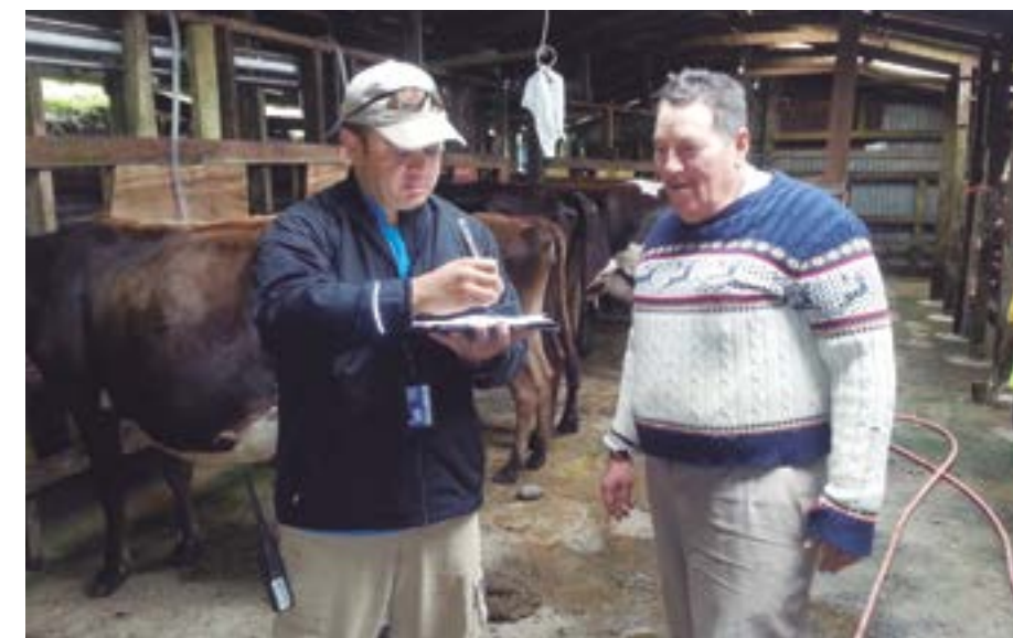
Desde el 7 de mayo y hasta el 24 de mayo funcionarios de la Coordinación de Servicios Regionales del TSE visitarán los cantones de Santa Cruz y Nicoya en Guanacaste.

La Esperanza Sur, Delicias de Garza, Río Montaña, Pilas Blancas, Barco Quebrado, Silencio, San Fernando, Santo Domingo y Santa Elena (parte oeste), comunidades pertenecientes al cantón de Nicoya.