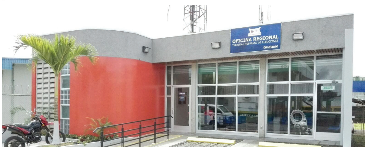
Fachada de la nueva Oficina Regional de Guatuso.

Por día los visitan entre 50 y 70 personas de diferentes zonas de San Carlos, como La Fortuna, Monterrey y Venado, así como de Los Chiles y Upala.