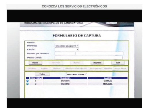
La página web institucional facilita las gestiones de los partidos políticos en el Tribunal, en la dirección http://www.tse.go.cr/servicios_partidos.htm .