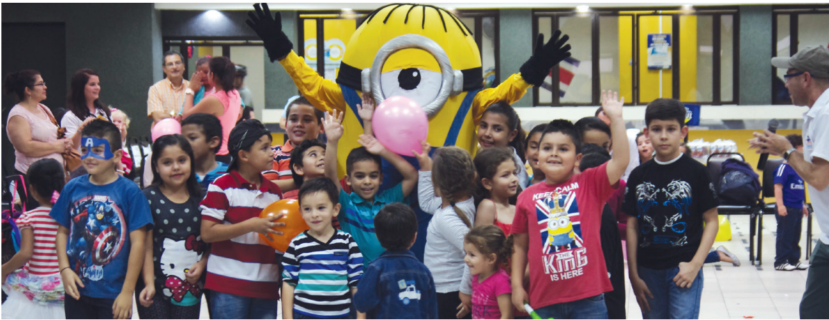
Como parte de las actividades de la Semana Cultural también se celebró el Día del Niño, con la asistencia de hijos de funcionarios.