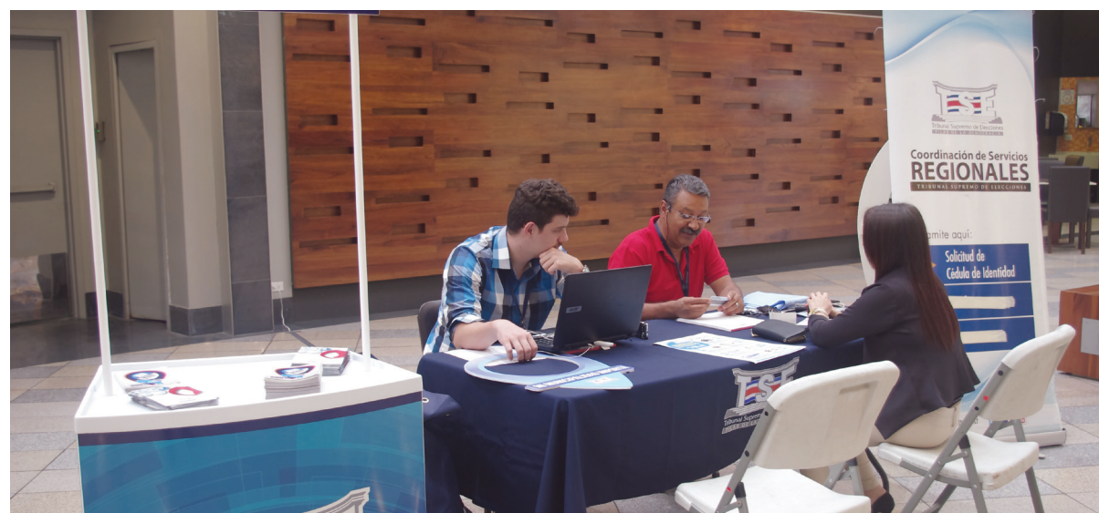
El quiosco ubicado en el centro comercial Paseo Metrópoli recibió cerca de 250 personas en los dos fines de semana que operó.

En total, en los seis centros comerciales se atendieron 1.194 trámites cedulares y 564 consultas.