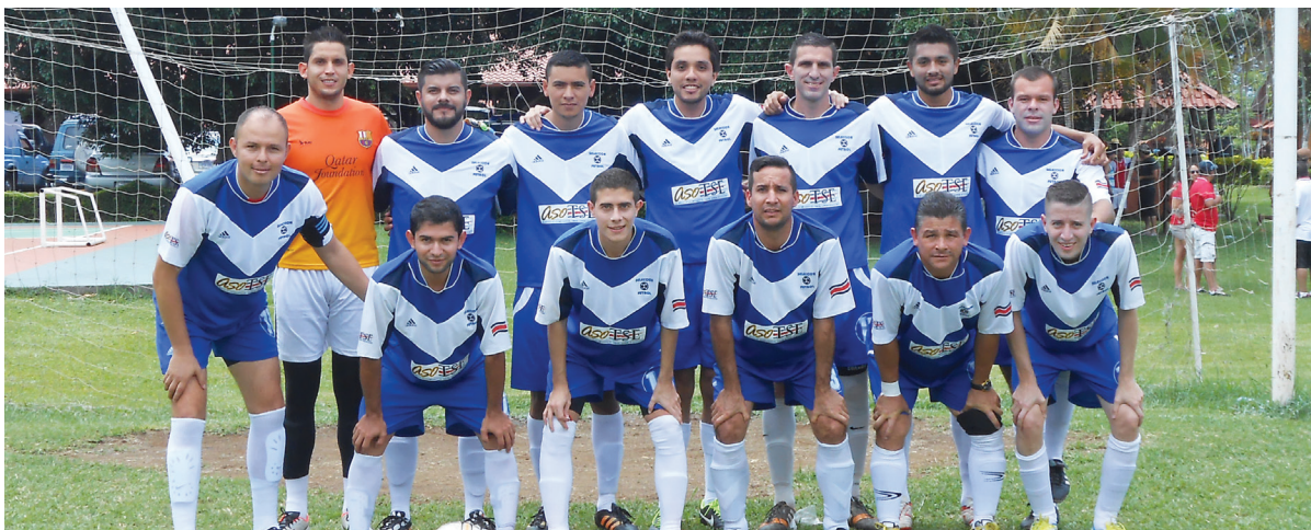
El equipo de Soporte FC fue el campeón del campeonato de fútbol por segundo año consecutivo.

A continuación, les presentamos un recorrido fotográfico por las principales actividades realizadas.