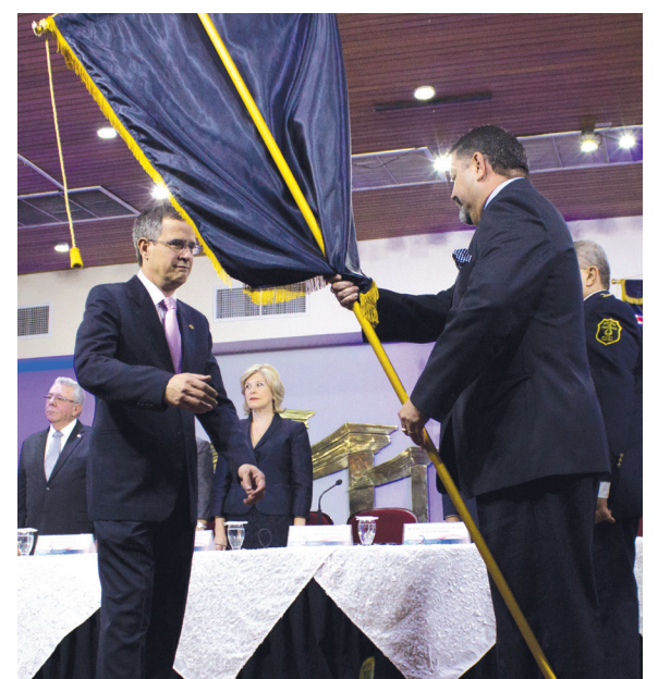
Gustavo Mata, ministro de Seguridad Pública, Gobernación y Policía, entrega el estandarte de la Fuerza Pública a Luis Antonio Sobrado, Presidente del TSE, como acto simbólico del traspaso del mando policial al órgano electoral.