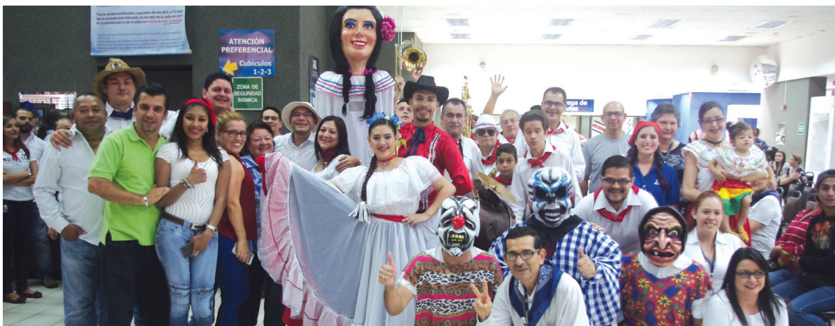
Muchos funcionarios se apuntaron a bailar con la alegre cimarrona y sus mascaradas.