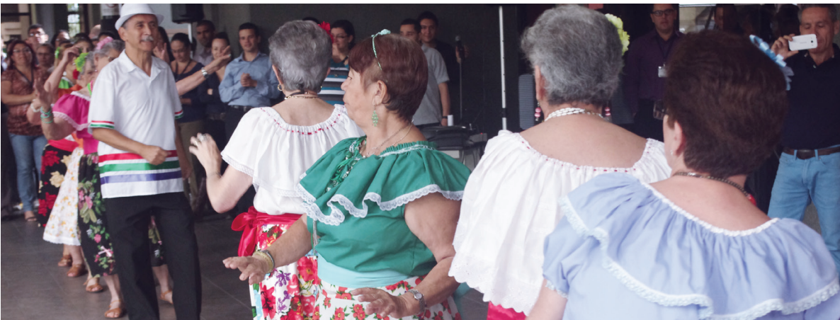
El grupo Perlas Doradas, de la Asociación Gerontológica Costarricense, realizó una presentación artística en la entrada del edificio electoral.