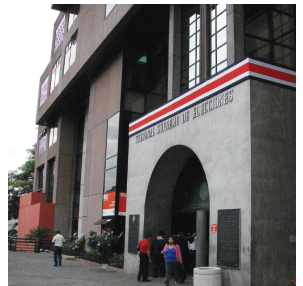
Todas las empresas encuestadoras que difundan sondeos de opinión durante el periodo electoral deben estar inscritas ante el TSE.

En todo el periodo electoral tampoco se permite la divulgación de estudios elaborados por entidades no registradas ante el TSE.